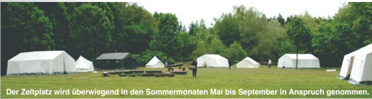
Der Zeltplatz wird überwiegend in den Sommermonaten Mai bis September in Anspruch genommen.